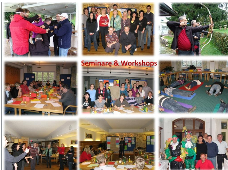
Seminare & Workshops