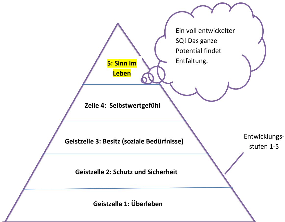
Abbildung: nach Maslows Bedürfnispyramide

Entkommen Sie dem Sumpf der „Triebhaftigkeit“.